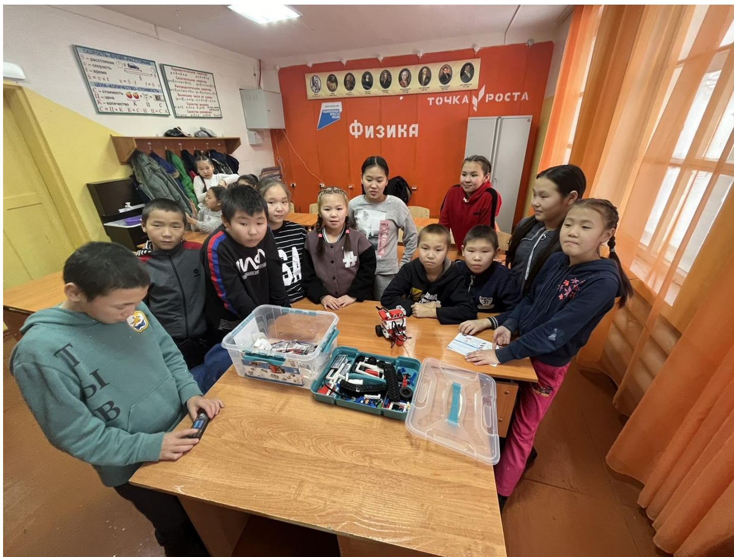
Внеурочное занятие по Робототехнике для 5-6 классов