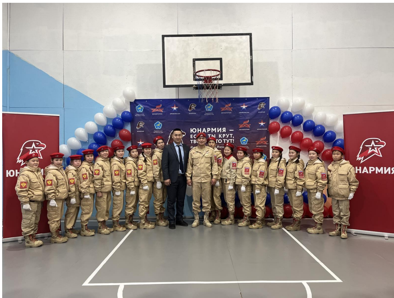
Военно-патриотическое движение "ЮНАРМИЯ"