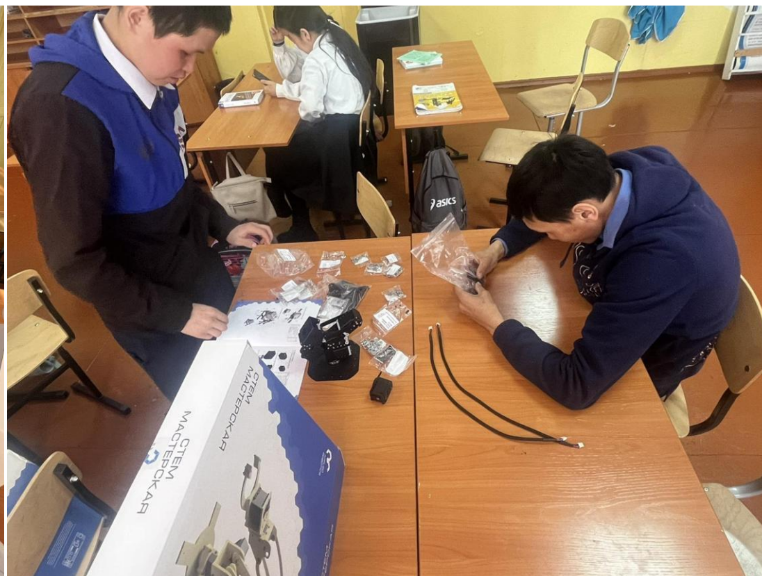
Внеурочное занятие по «3Д моделированию»