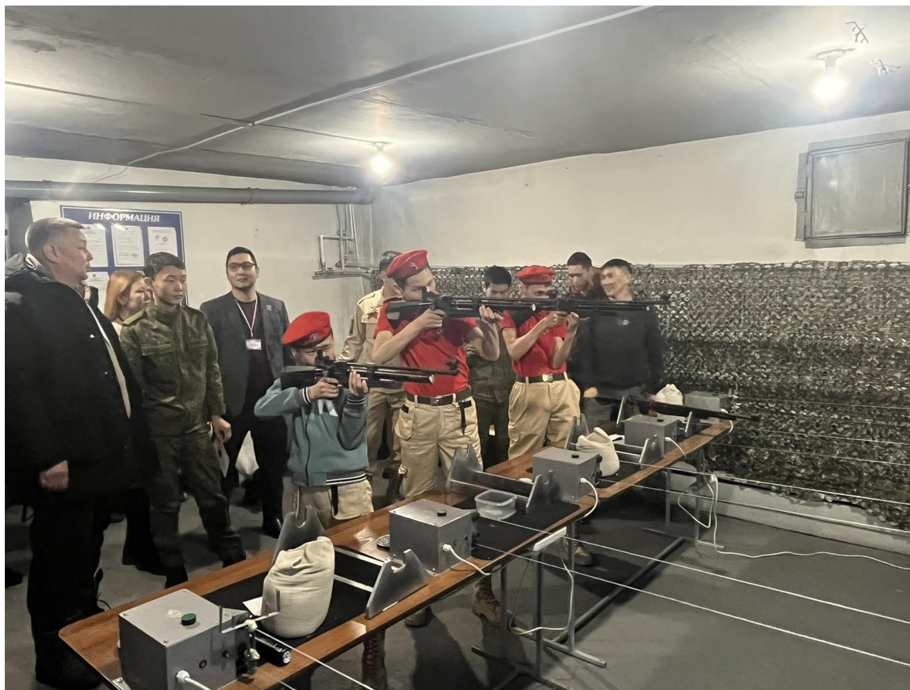
Участие в республиканском конкурсе по стрельбе из пневматического оружия